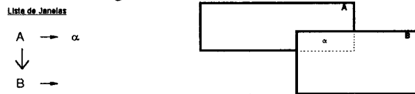
Figura 1: superposição simples

Além disso, cada janela da lista contém uma lista das áreas obscurecidas por outras janelas. Assim, supondo a ocorrência da Figura 1, onde a janela A é parcialmente obscurecida pela janela B (com maior prioridade que A), obtém-se a estrutura de listas ilustrada na figura.