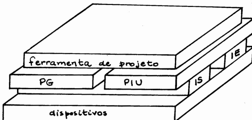
Fig. 1- Ferramentas de apoio e projeto.

A figura 1 mostra a organização das ferramentas de projeto com o uso das ferramentas de apoio mencionadas.