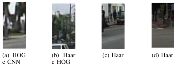
Figura 4. Exemplos dados como falso positivo pelas técnicas listadas abaixo de cada imagem

Com a análise de todas as estatísticas é possível perceber que a CNN, quando não apresenta os melhores resultados, está bem próxima do melhor, ratificando o fato desta técnica ser considerada o estado da arte. A segunda melhor técnica nesta análise foi a abordagem com HOG e SVM, obtendo resultados bem próximos a CNN. Esse fato pode ser explicado por ser