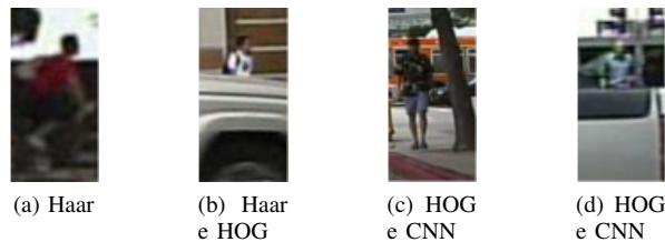
Figura 3. Exemplos dados como falso negativo pelas técnicas listadas abaixo de cada imagem

Para ilustrar as estatísticas encontradas a Figura 3 e Figura 4 mostram exemplos classificados errados pelas técnicas.