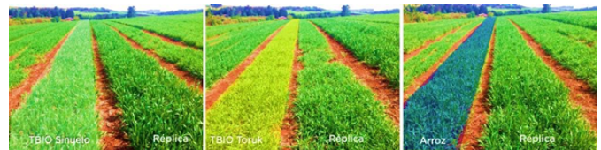
Figura 1. Canteiros das cultivares utilizadas no experimento

Ainda para este experimento, a empresa parceira indicou e fez o plantio de seis canteiros, com três tipos de sementes do trigo: TBIO Sinuelo, TBIO Toruk e Arroz (dois canteiros para cada cultivar), conforme apresenta a Figura 1.